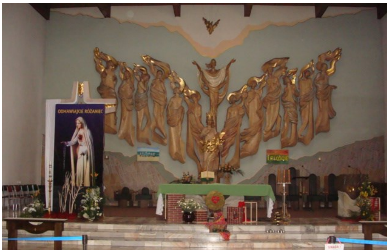
Parochiekerk in Rybnik

De zusters leren kennen was voor mij een grote gave. Ik noem niet iedere zuster bij de naam maar ik dank God voor ieder van u. Ik leerde van u hoe ik steeds bewuster, zonder angst en vol vertrouwen een ‘klei’ in de handen van de “Pottenbakker’ kan worden.