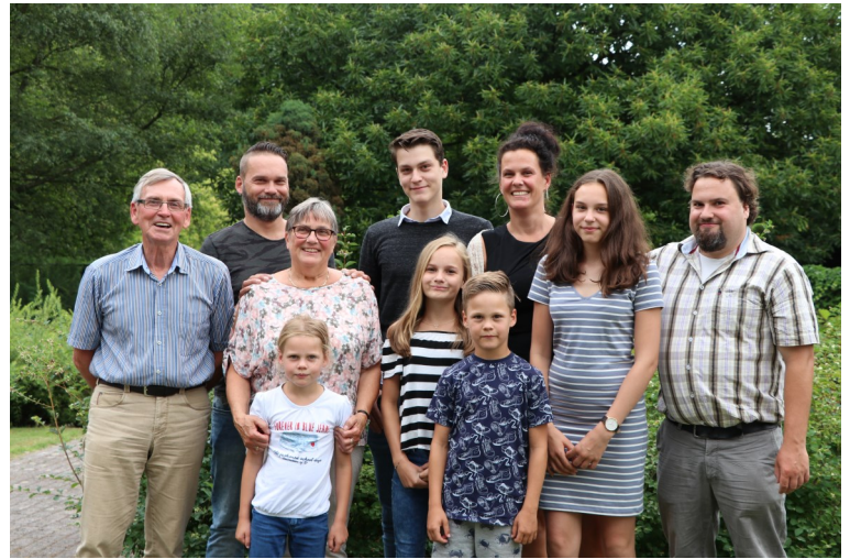
Ria en familie