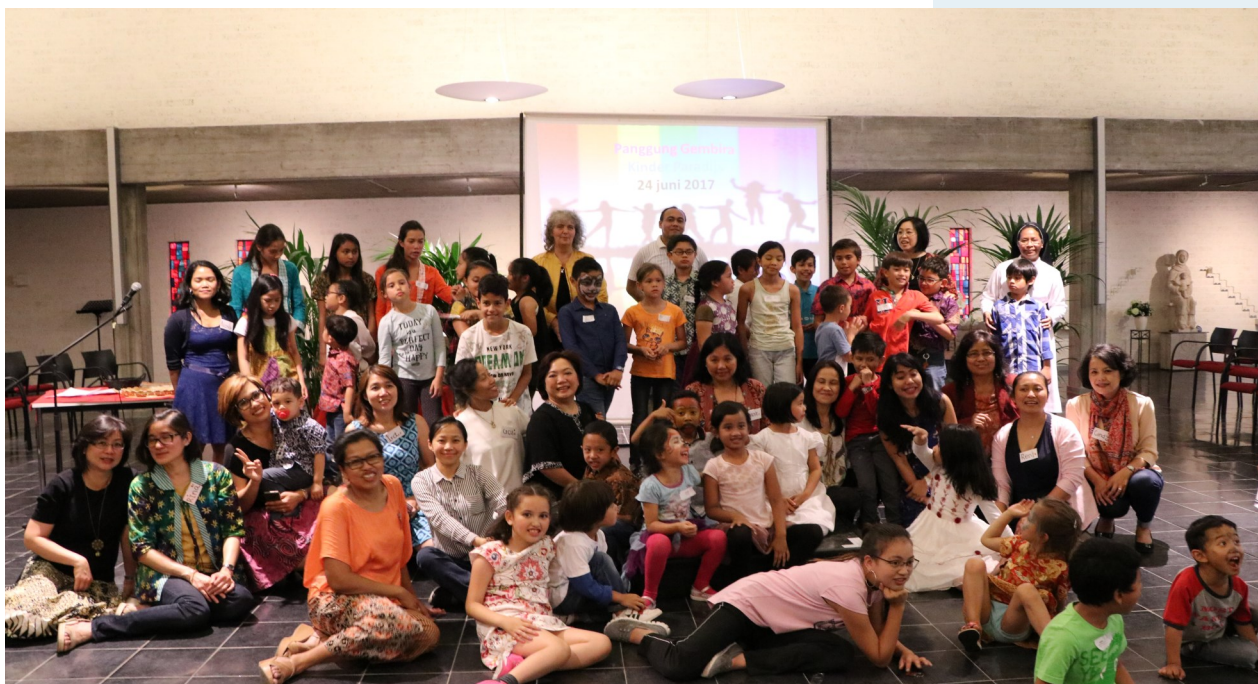
De deelnemers aan Kinderparadijs

December zal een drukke maand voor ons worden: we gaan verhuizen; we organiseren 'n Kerstmaaltijd voor ouderen; we delen Kerstpakketten voor mensen uit.