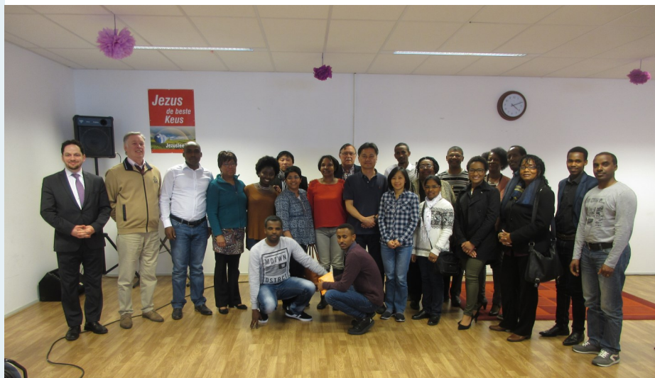
De deelnemers van SKIN cursus

“Dit Trinitaire aspect van de missie heeft ons geïnspireerd om als migranten in dit ‘missieland’ te blijven werken.”