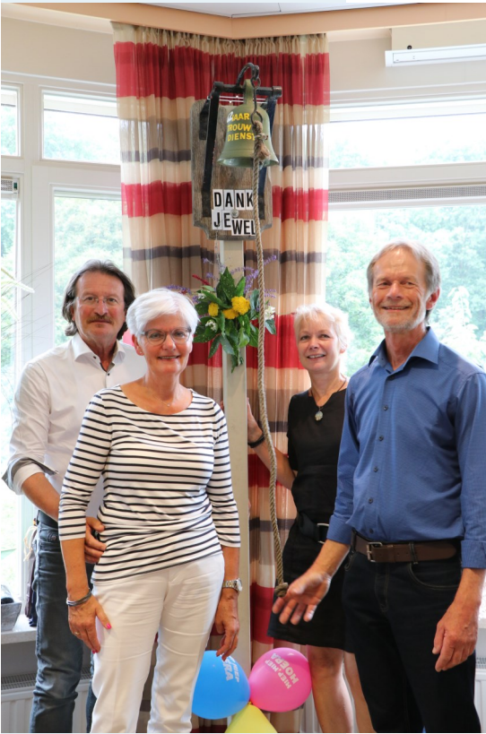
Ton en familie