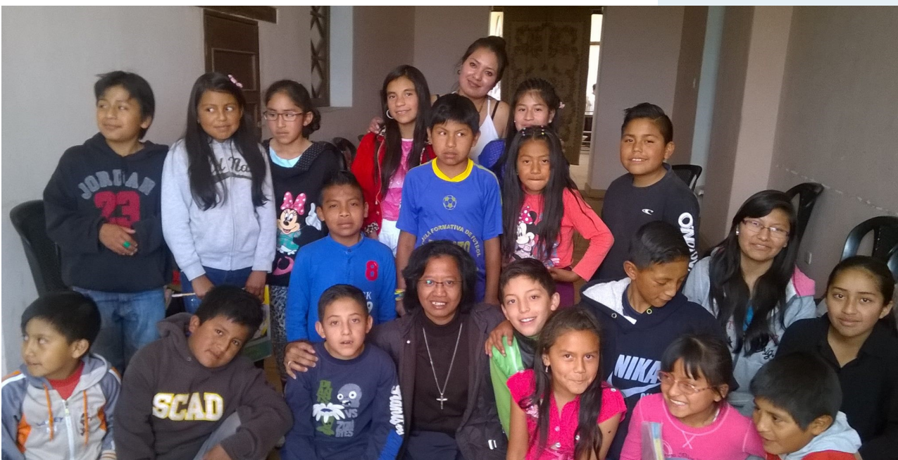
Activiteiten met kinderen in de parochie

Het apostolaat van de zusters in Ecuador richt zich op het pastorale en catechetische werk. De meerderheid van de bevolking in Ecuador is Rooms Katholiek. Er zijn veel sekten van christelijke culturen in Ecuador en er is een zeer sterke verering voor de Heilige Maagd Maria, wat wel begrijpelijk is omdat zij de beschermster is van de staat Zuid Amerika en Moeder Maria heel dicht bij het dagelijkse leven staat van iedereen. Daarom geven zij aan Maria meer eerbewoon dan aan Jezus of aan het Heilig Sacrament. Steeds meer mensen komen naar de kerk om de rozenkrans te bidden in plaats van de aanbidding van het Heilig Sacrament. Het is een geweldige opgave met name voor de SSpS en SVD om op creatieve wijze door catechese en preken de mensen te doen begrijpen dat Jezus het allerbelangrijkste is.