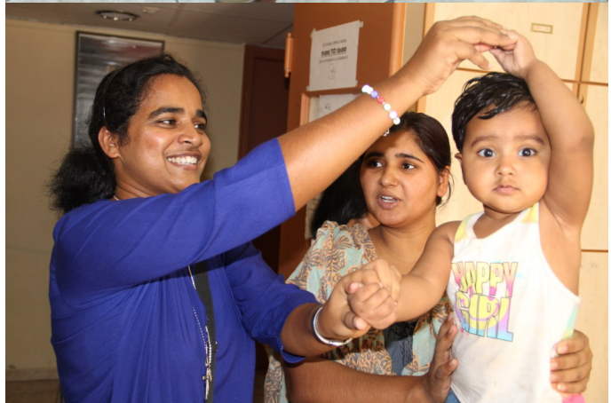
Activiteiten in het centrum van JRS

“We blijven jullie ook vragen om voor onze zusters in Athene te bidden.”