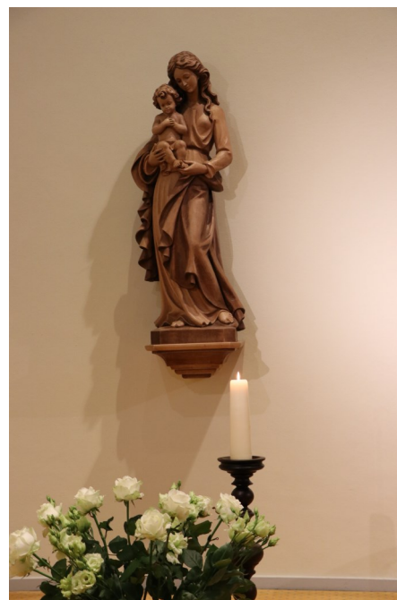
Mariabeeld in de kapel van het Retraitehuis

Samen met de zusters van het Arnoldusklooster hadden we een Internationale ontmoetingsdag. Onze medezusters die aan het Tertiaat in Steyl deelnamen kwamen op bezoek. Op zo’n dag ervaren we weer dat we, zo veelkleurig en verschillend als we zijn, onderdeel zijn van een groter geheel, wereldwijd. Wat een wonder!