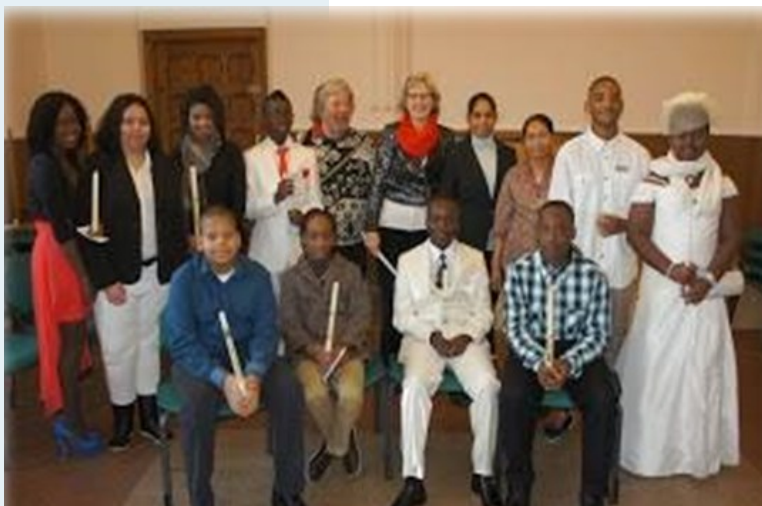
Eerste communie in de Marthakerk