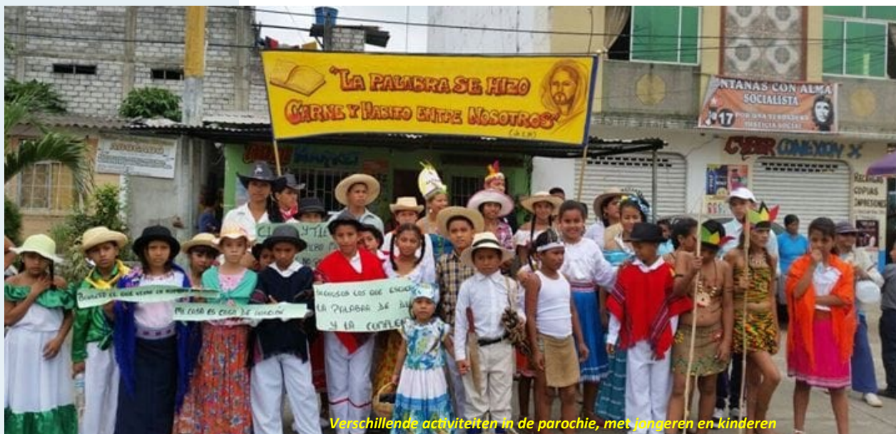
Verschillende activiteiten in de parochie, met jongeren en kinderen