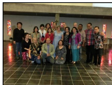
KKI regio Tilburg